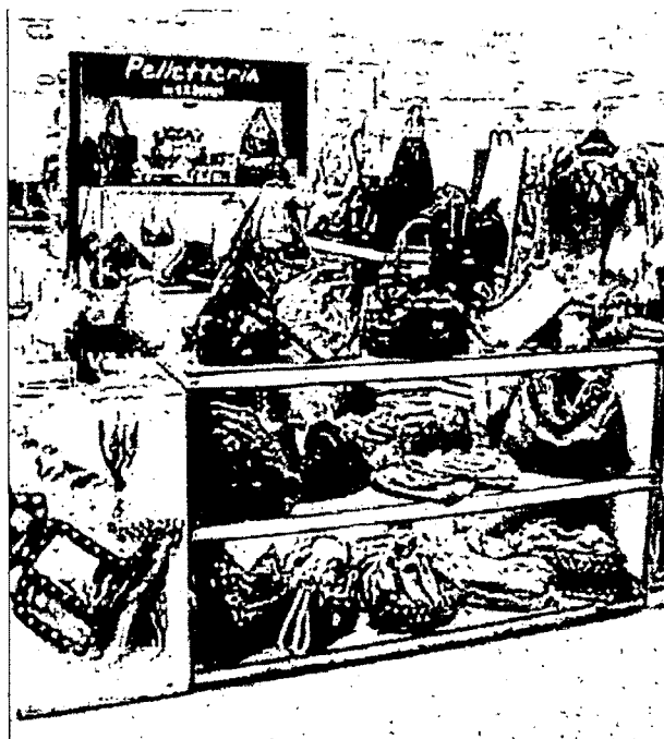
In mostra il meglio della produzione Made in Italy

Ma il calendario degli eventi di I-Place è molto ricco: da ora a ottobre sono previsti altri sette appuntamenti. Agli eventi che verranno effettuati all'interno di I-Place, nel 2007, si aggiungeranno altri sette eventi che toccheranno le piazze di New York, Londra, Mosca, Dubai.