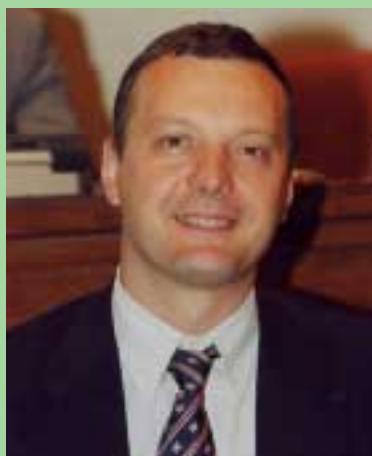
Tommaso Franci, Assessore regionale Ambiente e Tutela del territorio, Protezione civile e Politiche per la montagna

■ Quasi tremila progetti finanziati, alcuni già conclusi e molti in fase di realizzazione. Il primo biennio di attuazione del Docup presenta un bilancio ampiamente positivo. Numerosi e di grande peso anche i progetti che puntano a ridurre i fattori di rischio ambientale. Con i contributi dell'asse 3 del Docup (asse Ambiente) sono stati finanziati centinaia di progetti presentati dagli enti pubblici e dalle imprese private. Abbiamo chiesto all'assessore regionale all'ambiente Tommaso Franci di fare il punto sull'asse 3 del Programma.