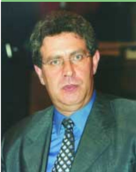
Riccardo Conti, Assessore regionale Urbanistica, Infrastrutture, Viabilità, Trasporti e Casa.