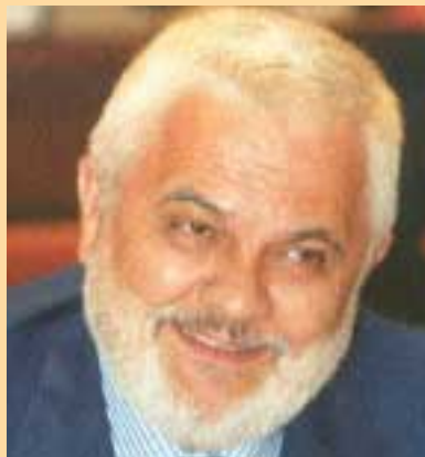
Ambrogio Brenna, Assessore regionale allo Sviluppo economico e Presidente del Comitato di sorveglianza del Docup

L'azione del Docup sullo sviluppo dell'economia toscana non trascurava la cultura, uno dei maggiori patrimoni della nostra regione. Il Programma Docup contiene misure specifiche che consentono di sostenere interventi volti alla valorizzazione del bene culturale in sé e non solo come attivatore di economie derivate. Adesso è possibile finanziare il restauro di un castello o di un palazzo per il suo intrinseco valore culturale ed artistico, mentre negli anni precedenti ogni aiuto era condizionato alle attività previste all'interno del bene o ad esse collegate, come la realizzazione di un ristorante, di un albergo, ecc. Riconoscere nel valore culturale un elemento in grado di attivare ricchezza è stata una conquista fondamentale per la nostra regione ricca di monumenti ed opere d'arte.