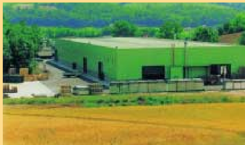
Lo stabilimento della Pan Urania

e oggi i risultati sono evidenti. L'organizzazione interna è più efficiente, è migliorata la qualità del prodotto e dei processi lavorativi, abbiamo riscontrato una maggiore soddisfazione dei clienti . Si sono ridotte le contestazioni, ora le osservazioni e i suggerimenti dei clienti hanno una risposta immediata e tutto questo ha provocato effetti positivi anche sul mercato . E' migliorato tutto, anche i rapporti con i fornitori; inoltre abbiamo avuto una riduzione sensibile degli scarti di lavorazione".